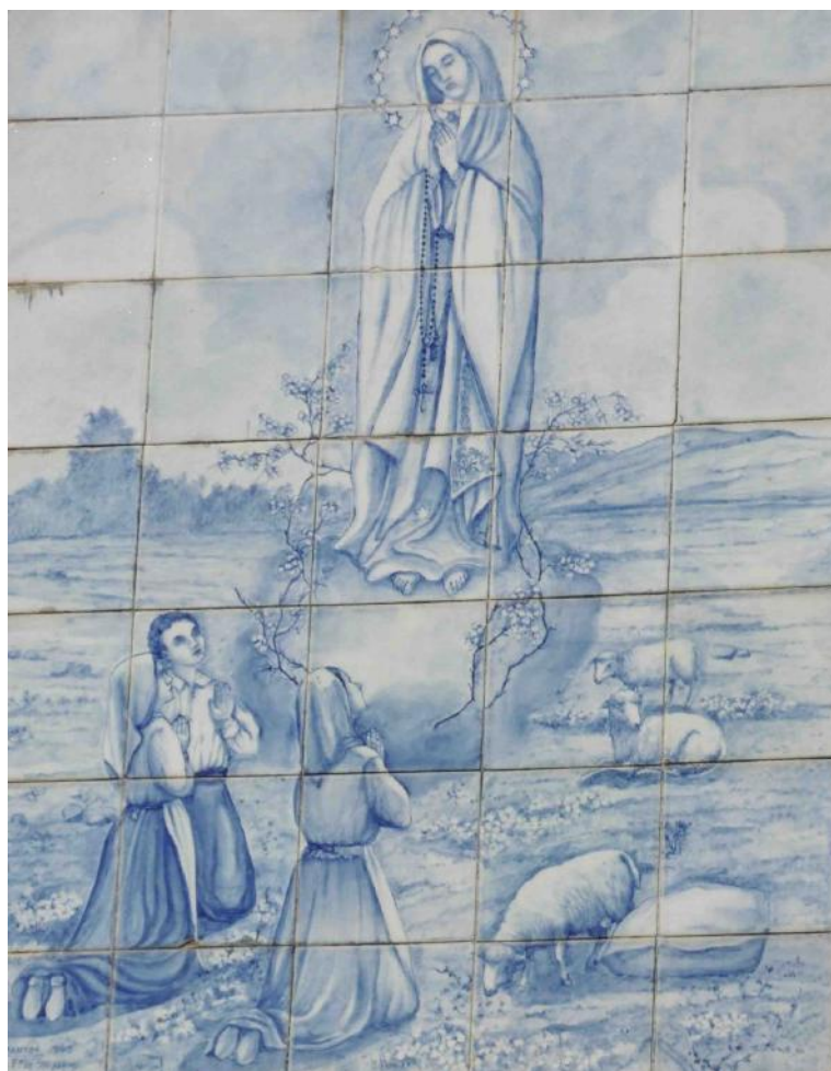
Azulejo de l'apparition de ND de Fatima, Place du village de São Pedro de Rates