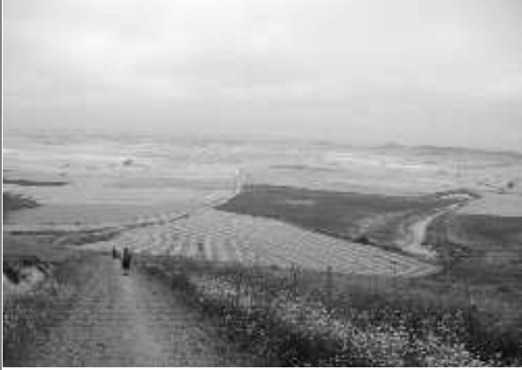
Sur le chemin entre Castrojeriz et Itero de la Vega

Chemin de pénitence : en partant de chez soi, chacun prend dans son jardin un caillou ou une pierre pour le déposer au pied de la Cruz de Ferro (Croix de fer). Ce caillou représente nos péchés que nous abandonnons en ce lieu de façon à finir le chemin l'âme en paix, prêts à prendre de bonnes résolutions à mettre en pratique quand nous rentrerons dans notre foyer. En conséquence, ce pèlerinage ne peut être profitable qu'avec un prêtre qui accompagne les pèlerins.