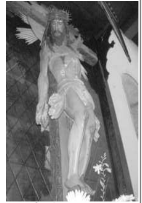
Le Christ de Furelos

Avoir la Messe tous les jours, pouvoir se confier et se confesser sont indispensables à notre équilibre spirituel.