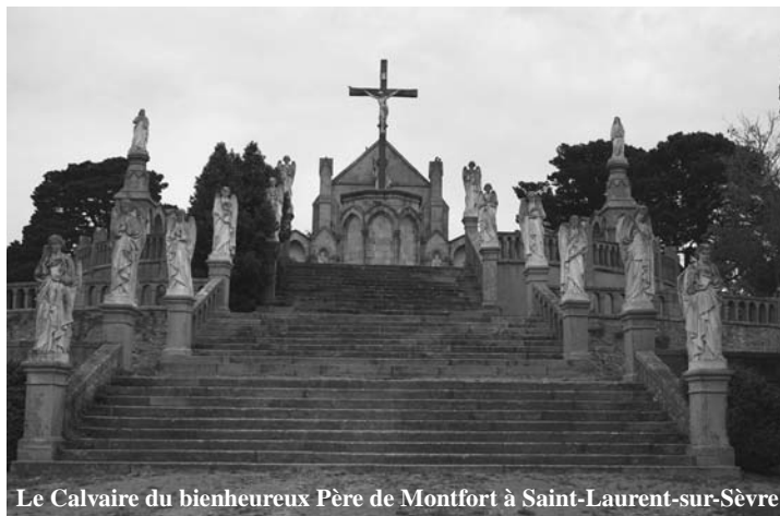
Le Calvaire du bienheureux Père de Montfort à Saint-Laurent-sur-Sèvre

L'association RU de notre ami Wurmeling est toujours aussi "rétrograde", pour la plus grande gloire de Dieu. Elle sauve des enfants de "l'avortement" et distribue des tracts pour évangéliser les musulmans qui lui font un bon accueil, estimant son action plus "digne" sans doute de la part d'un chrétien qui a la Foi, la défend et veut la faire partager. Certains vont commencer leur catéchisme. Ceux qui veulent distribuer des tracts peuvent prendre contact à cette adresse: bnm.amen@orange.fr