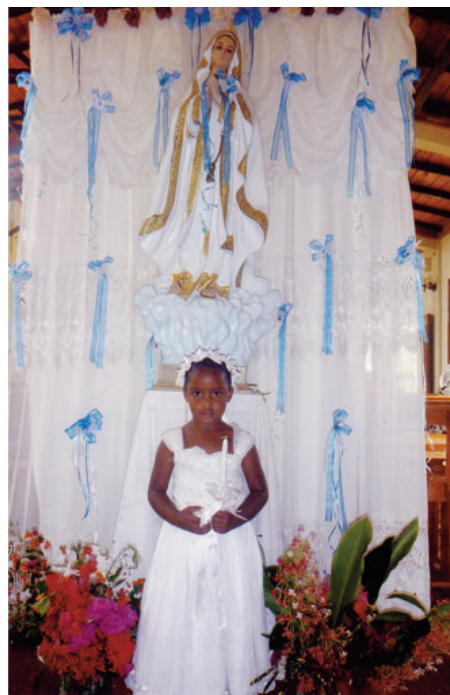
Communion solennelle en République Dominicaine sous la protection de la Sainte Vierge

Et voici que le cardinal Kasper propose d'envisager que des éléments du sacrement de mariage se trouvent dans un mariage simplement civil ! Et puis, n'ont-ils pas pris l'habitude de faire ce qui leur plaisait, depuis la communion dans la main malgré l'interdiction formelle des cardinaux de la curie ?