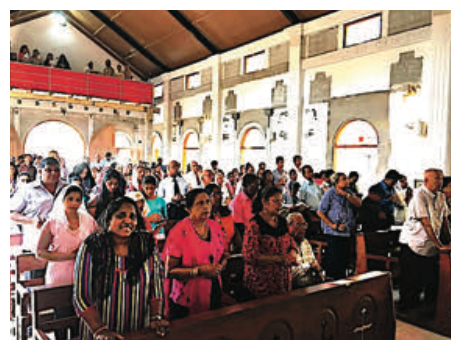
Messe à N-D de Guadalupe

Lorsqu'il était connu autrefois sous le nom de Ceylan, il évoquait tout autre chose. Ceylan est encore aujourd'hui