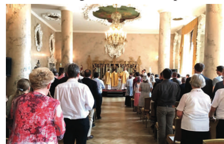
Messe dans la salle de bal de l'hôtel Léningradskaja

C'est dans la vaste salle de bal de l'hôtel Léningradskaja, sur la place des