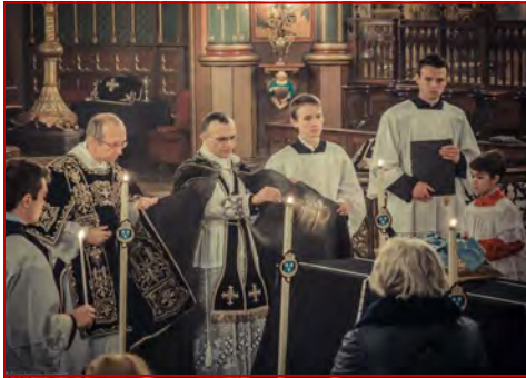
Dans l'absoute, on se sert de l'encens réservé à honorer Dieu et ses amis

Dans une étude du Crédoc sur les obsèques, publiée en 2007, on lisait sur la crémation : « La première raison de son choix est “pour ne pas embarrasser la famille” (35 %), la seconde “pour des raisons écologiques” (24 %). Une fois encore revient une sorte de gêne, et même une