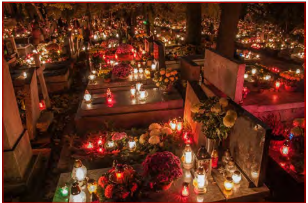
Le cimetière, lieu de repos dans l'attente de la résurrection

Depuis que le terme d' "incinération" sert