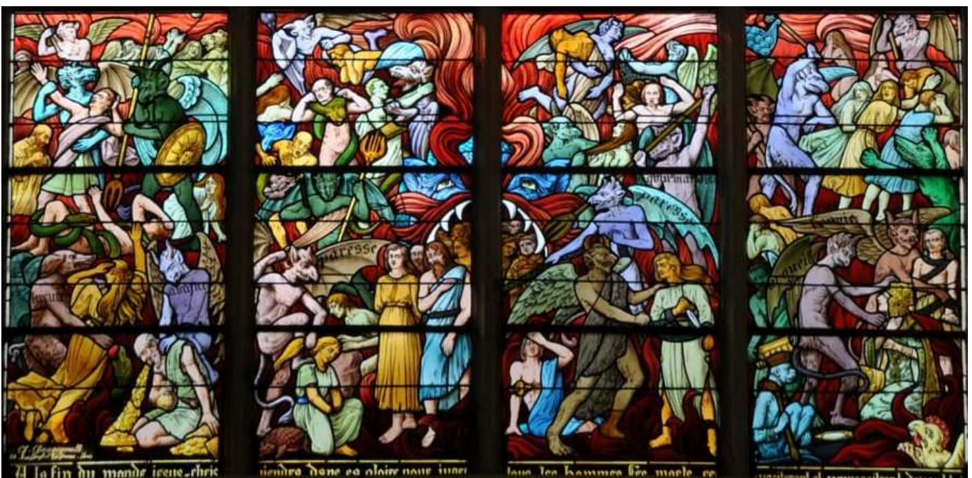
Vitraux de l'église Saint-Rémi de Troyes — Les péchés capitaux sont inscrits sur les ailes des démons

Ceux qui vivent avec nous connaissent généralement assez bien notre défaut dominant qui est souvent un obstacle au bien commun. Puisseons-nous le connaître nous-mêmes et supporter qu'on nous le fasse remarquer, si notre examen de conscience trop superficiel ne nous le manifeste pas encore.