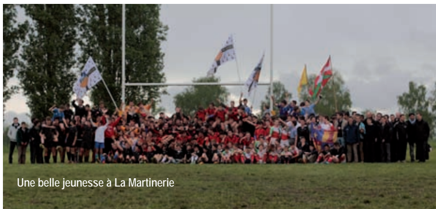
Une belle jeunesse à La Martinerie

La classe de troisième passe le CFEPC, notre concours inter-école.