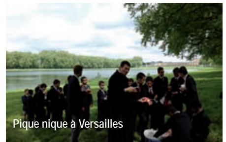
Pique-nique à Versailles

Dans le même temps, notre chorale se rend à Versailles, pour y chanter la messe du dimanche et présenter quelques produits du far west . Il est vrai qu'il n'y avait pas beaucoup de place dans cette belle chapelle, mais nous avons l'habitude de prier tassés.