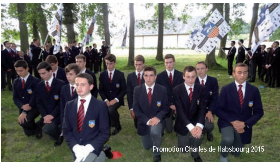
Promotion Charles de Habsbourg 2015

Il faut des hommes conscients de la gravité du combat qui doit être livré, et décidés à tous les sacrifices pour sauver l'esprit. Cela requiert des vertus héroïques. »