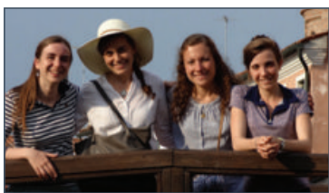
Voyage à Venise