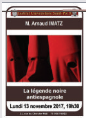
CD audio 10€

L'Institut Universitaire Saint-Pie X est un établissement d'enseignement supérieur sous Jury rectoral qui prépare aux licences européennes ou filières de Philosophie, d'Histoire et d'Humanités et dont les diplômés sont reconnus par l'État (excepté en philosophie). Il assure en outre une Formation des maîtres pour les futurs enseignants des écoles primaires et secondaires. Il est habilité à accueillir les étudiants boursiers de l'État en histoire et en humanités