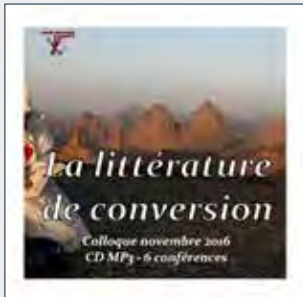
CD audio MP3 15€

L'Institut Universitaire Saint-Pie X est un établissement d'enseignement supérieur sous Jury rectoral qui prépare aux licences européennes ou filières de Philosophie, d'Histoire et d'Humanités et dont les diplômes sont reconnus par l'État (excepté en philosophie). Il assure en outre une Formation des maîtres pour les futurs enseignants des écoles primaires et secondaires. Il est habilité à accueillir les étudiants boursiers de l'État en histoire et en humanités