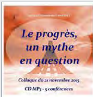
CD audio MP3 15€