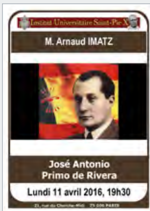
CD audio 10€