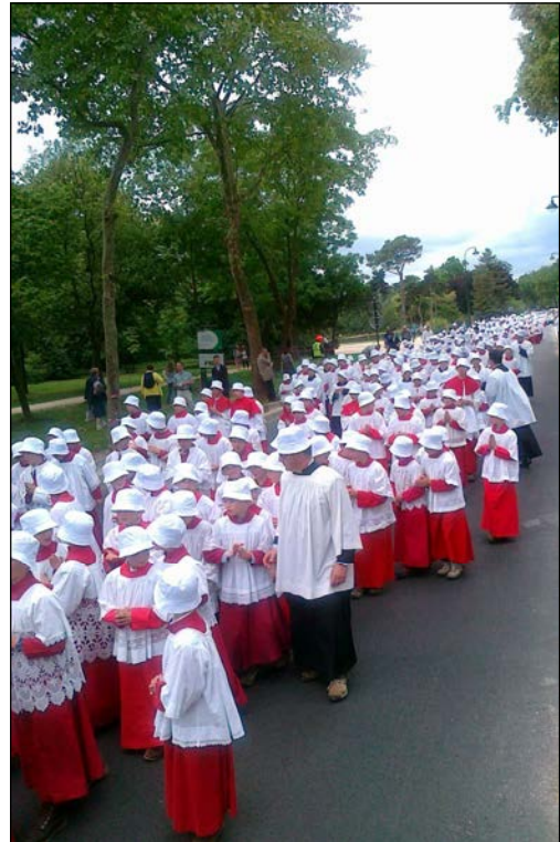
Pentecôte 2011 : de Chartres à Paris

En la fête de saint Thomas Apôtre, le 21 décembre 2011