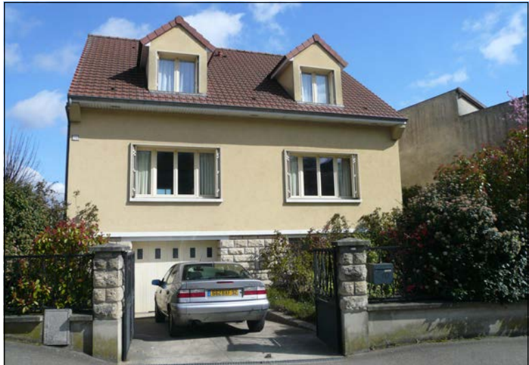
Fontenay-le-Fleury (78) : prieuré St-Vincent-de-Paul

Il y a bien évidemment quelque chose de vrai dans le mal dénoncé. Mais le remède est celui que l'Eglise a toujours indiqué : la tolérance. Le droit à la liberté religieuse, tel qu'il est proclamé à Vatican II, est autre chose. C'est là un des points sur lesquels nous achoppons avec le Saint-Siège.