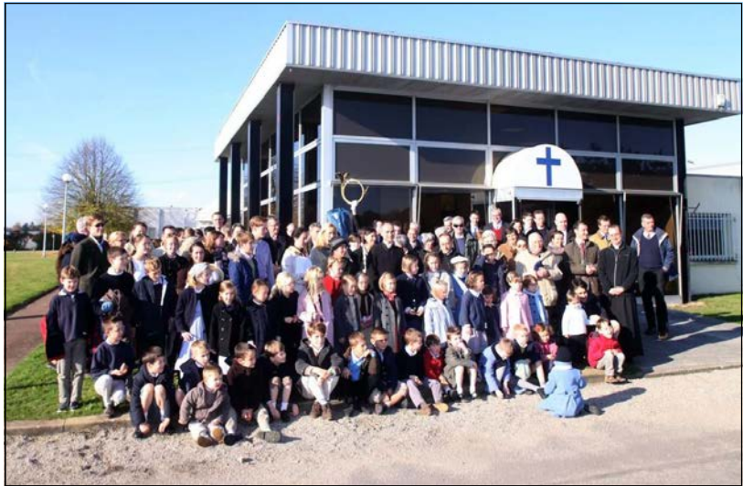
Les Essarts-le-Roi (78) : chapelle Saint-Hubert

Oh ! Certes beaucoup protestent qu'ils croient que Jésus est Dieu, mais bien peu sont prêts à tirer les conséquences concrètes de cette vérité fondamentale qui éclatera aux yeux du monde entier à la fin des temps. A ce moment-là, Il laissera enfin resplendir sa gloire dans toute sa perfection. L'étendue de ses pouvoirs sur toute créature sera telle que tous les hommes – païens, chrétiens, athées, mécréants, bandits et fidèles –, tous seront prosternés devant Lui, car à l'évocation de son Nom tout genou fléchira sur la terre comme au ciel (1) .