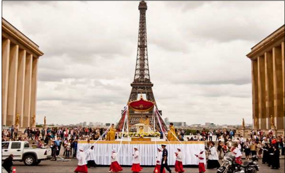
Pentecôte 2011 : le pèlerinage de Chartres à Paris

Ne la considérons pas de loin et sans nous sentir concernés car nous risquerions de passer à côté d'un trésor sans prix pour le restant de notre existence. Notre-