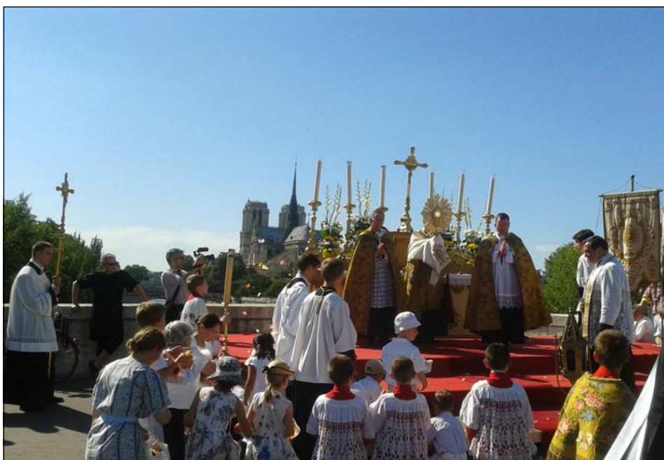
Paris (75) : la Procession de la Fête-Dieu en 2011

conclusion, qui semblerait logique, est contredite par les faits. Il existe de très nombreux domaines où la moindre remarque suffit déjà à constituer un grave délit qui sera sévèrement puni par les autorités politiques. Pourquoi cela ?