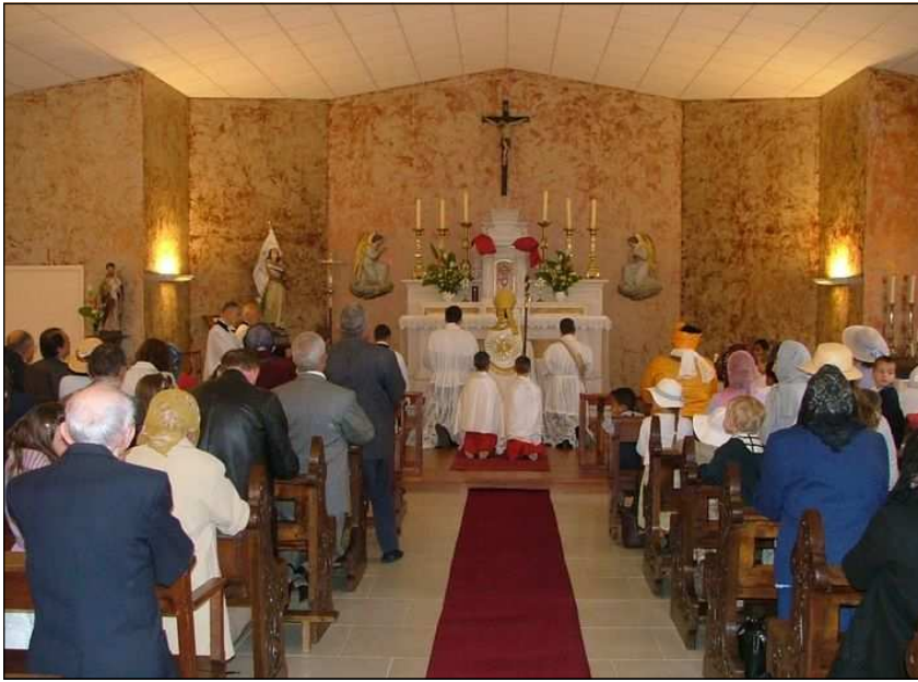
Besançon (25) : la chapelle St-Ferréol et St-Ferjeux

de la Toussaint, de se grimer et de se déguiser en démons. Si les grandes personnes refusent de donner des bonbons aux enfants qui viennent sonner aux portes pour leur en demander, gare à elles ! Les enfants disposent alors de « sorts » qu'ils peuvent leur jeter dessus. Aux plus grands, il est proposé depuis plusieurs années, à Clisson, un « festival de l'enfer » qui porte bien son nom. Tous les vices, toutes les débauches y règnent et ils sont accompagnés par des pratiques de magie et par un culte luciférien. Que l'on s'étonne ensuite de voir comment se banalise la profanation des tombes et des cimetières chrétiens où reposent nos pères ! Nous pourrions multiplier les exemples de cette entrée massive et visible du satanisme dans notre malheureux pays. La France, fille aînée de l'Eglise, n'a pas été fidèle aux promesses de son baptême. C'est au diable qu'elle semble aujourd'hui être livrée.