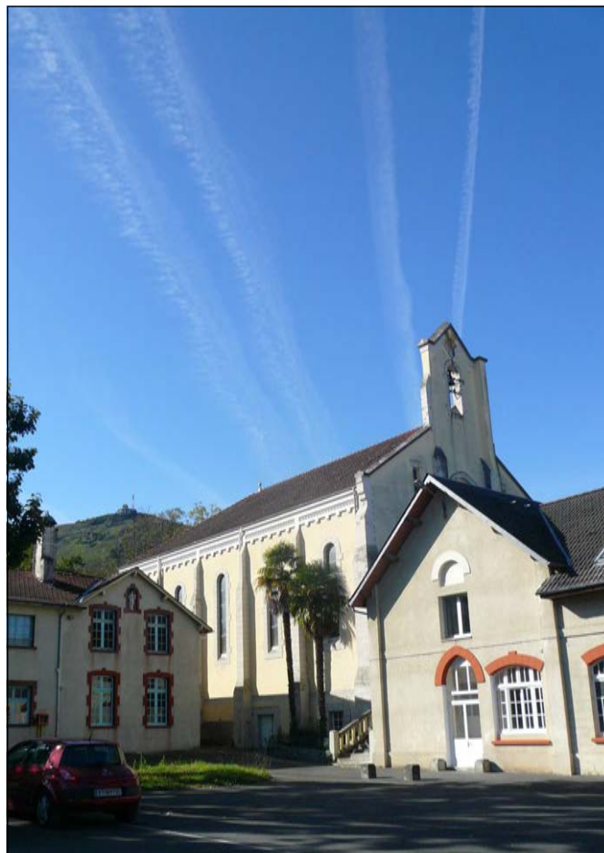
Lourdes (65) : la Maison Saint-Ignace

C'est bien cela que l'on nomme le règne du diable. Il est l'inspirateur de nos sociétés qui ont renié Jésus-Christ et qui se sont détournées d'un maître pour aller à un autre. Le vice se trouve codifié dans la loi en place de la vertu. L'art, éternel miroir des sociétés, cultive la laideur. Les sciences sont uniquement préoccupées d'une récréation artificielle d'un monde façonné par l'homme moderne. La vraie philosophie, comme recherche de la sagesse, est déconsidérée et méprisée. Jésus-Christ est haï. S'Il redescendait sur la terre, les hommes n'attendraient certes pas trente-trois ans pour le crucifier de nouveau. Satan triomphe.