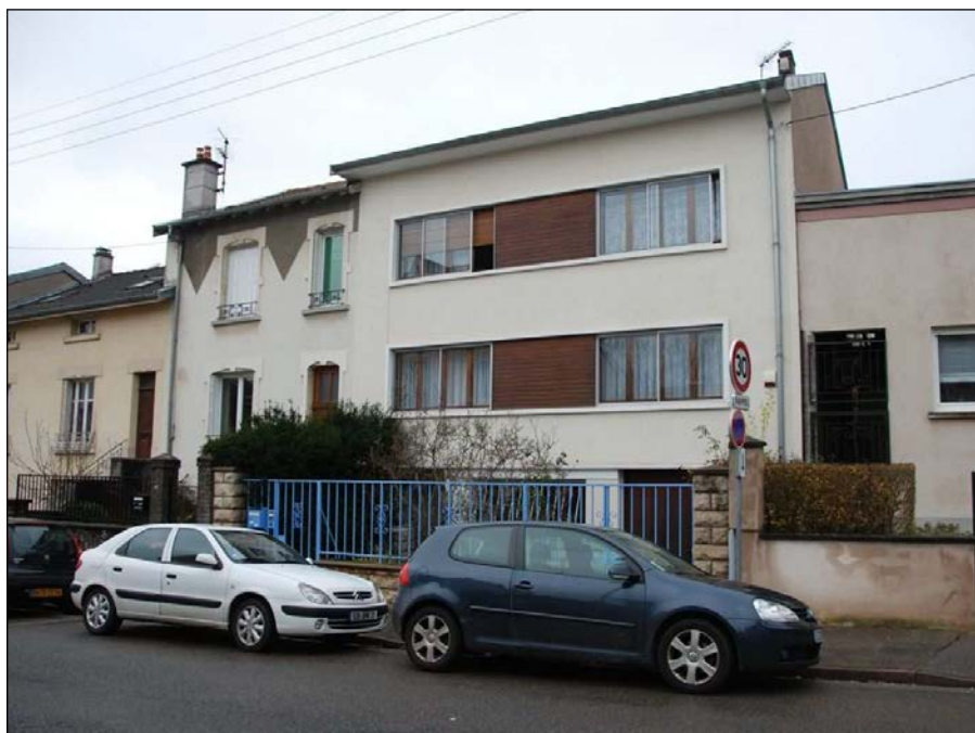
Nancy (54) : le prieuré Saint-Nicolas

du moment qu'il le veut et qu'il n'empiète pas sur le domaine de la liberté de ses voisins. C'est donc au nom du respect de sa dignité d'homme qu'il faut le laisser s'adonner à tous les instincts et à tous les caprices de son moi divinisé.