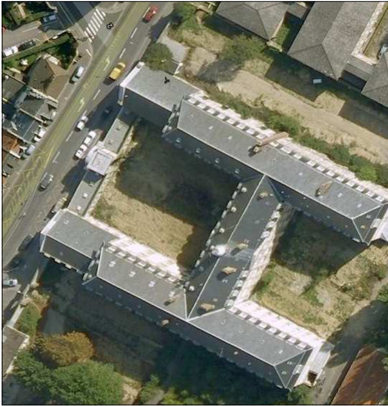
Caserne Dejean à Amiens (80) : la future chapelle

doivent de prêcher ces vérités afin que les catholiques prennent garde d'oublier l'opiniâtreté de celui qui « rôde autour d'eux comme un lion rugissant cherchant qui dévorer ».