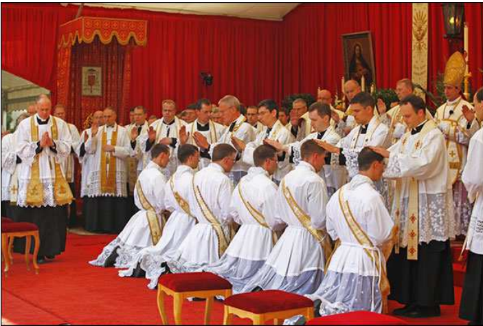
Ordinations, Zaitzkofen, 30 juin 2018

Le prêtre vit comme un dialogue permanent avec sa messe, ou avec