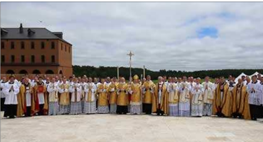
Ordinations, Dillwyn (États-Unis), 22 juin 2018

La nuit tombe sur la grande métropole d'un million d'habitants. On s'affaire dans les cuisines de milliers de foyers. Les robots vrombissent, les ordinateurs éclairent les visages bleuis de leur lumière blafarde, les usines produisent encore à haut régime. Des centaines de milliers de lampes éclairent magasins, bureaux, et chambres comme en plein jour. Mais il ne fait plus jour. Portés par cette lumière artificielle, les hommes n'y pensent pas : il ne fait plus jour. Pour qu'ils s'en rendent compte, il faut un évènement inattendu, une brusque coupure de courant, plongeant le million d'âmes dans le noir.