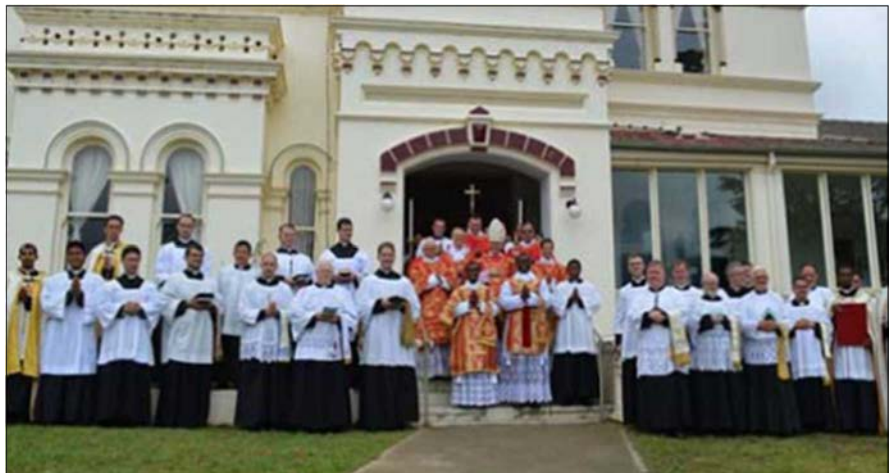
Ordinations, Goulburn, 13 décembre 2018

Alors, dans le Concile les ennemis de l'Église se sont infiltrés, et le premier objectif qu'ils ont eu a été de démolir et de