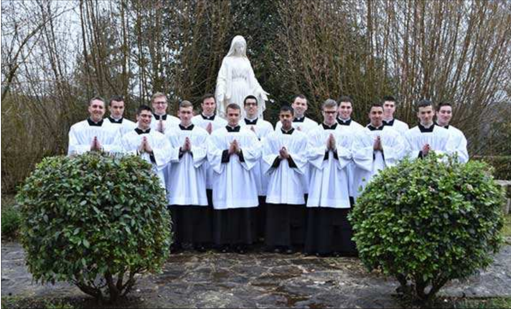
16 nouveaux séminaristes à Flavigny : 12 Français, 2 Anglais, 1 Portugais et 1 Suisse

« Persévérons dans la prière, dit saint Augustin, Dieu peut différer ses dons, mais il ne les refuse pas. » L'injonction est importante : il faut persévérer et toujours prier, car nous périssons.