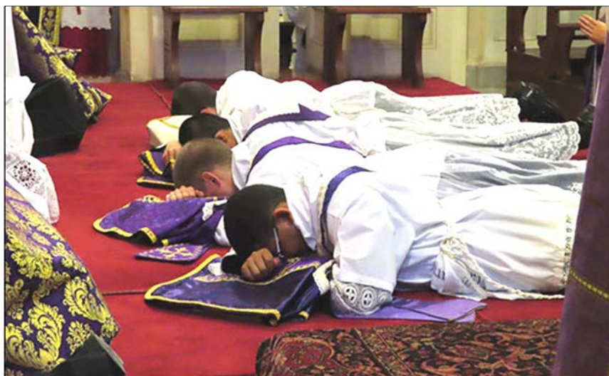
Ordinations, La Reja (Argentine), 22 décembre 2018

Les catholiques peuvent venir puiser constamment dans ces mérites infinis de la messe. Aucun risque d'en tarir la source, puisque ces mérites sont ceux de Dieu le Fils, donc infinis. Plus les âmes sont faibles, pécheresses, plus elles trouvent secours en cet abîme insondable de grâces. Les âmes pieuses se sentent naturellement attirées de plus en plus vers une assistance fréquente à la messe. Car chaque messe est riche de la richesse même du calvaire !