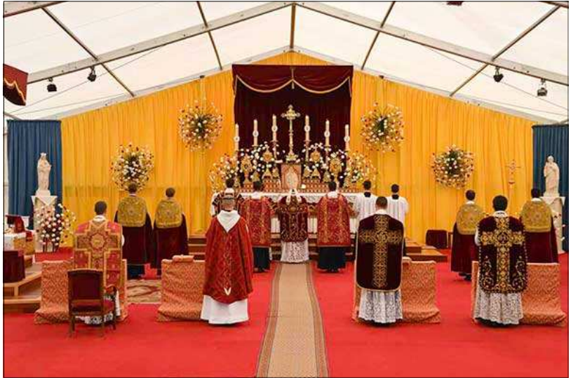
Ordinations, Écône, 29 juin 2018

Puis une panne de courant est arrivée, avec le concile Vatican II les fumées de Satan sont entrées dans l'Église, comme le pape Paul VI le notifiait. Peu à peu, à la faveur de cette obscurité grandissante, la foi est devenue subjective, sans force, l'espérance s'est concentrée sur les moyens humains au dépend des moyens évangéliques, la charité fut détournée en vague solidarité philanthropique ; la force de l'Église apparut comme faiblesse devant les puissants de ce monde, sa prudence comme pure diplomatie, sa justice fut mise au service des droits de l'homme, pourtant si injustes, sa tempérance disparut au moins en apparence, au profit des pires scandales.