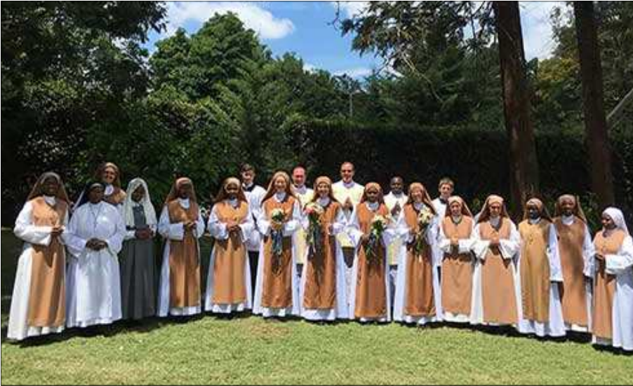
Premiers vœux et renouvellement des Sœurs missionnaires de Jésus et Marie, Kenya, 21 novembre 2018

C'est en remettant à sa vraie place le saint sacrifice de la Messe que la lumière du calvaire et de l'amour infini se livrant pour nous va de nouveau éclairer le monde entier. Celui-ci comprendra le mal du péché, en voyant la nécessité d'offrir le sacrifice du calvaire chaque