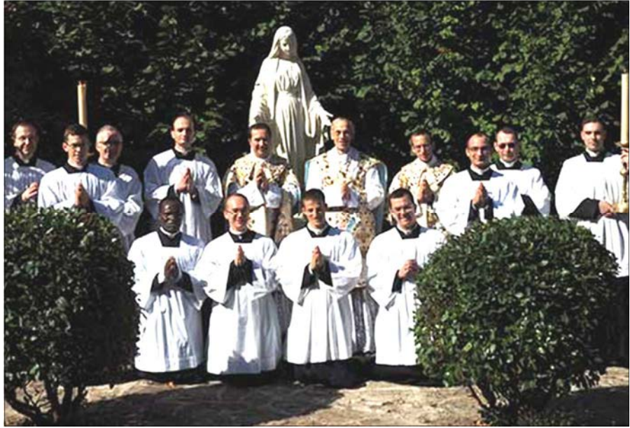
Premières professions et vœux perpétuels de Frères de la Fraternité Saint-Pie X, Flavigny, 29 septembre 2018

Quand il s'est agi de traduire en acte l'amour qu'il nous portait, le Christ s'est sacrifié, il a souffert pour nous. Celui qui découvre ce lien profond entre l'amour et le don de soi, entre l'amour rédempteur et l'expiation