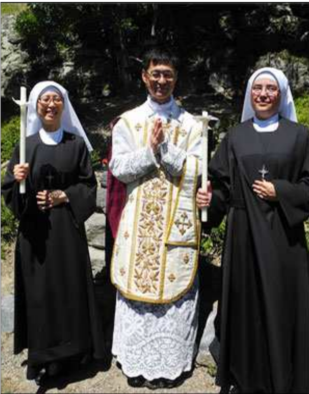
Prise d'habits de Sœurs Oblates, Noviciat de Salvan, juin 2018

LA FOI. Lorsqu'il célèbre, le prêtre est obligé de poser formellement des actes de foi. Il ne voit rien, ne sent rien, mais sait ce qu'il fait – l'offrande du sacrifice du calvaire – car Dieu l'a révélé. La transsubstantiation est réelle, car Dieu l'a révélée. Sa certitude est totale parce qu'elle ne se base que sur la révélation du Fils de Dieu à son Église. Elle nous plonge dans un monde divin, dans le mystère de la foi, loin des apparences contraires. Un tel point de départ nous fait ensuite marcher avec vaillance et intrépidité dans la foi, loin des doutes. C'est alors que les joies les plus pures se trouvent.