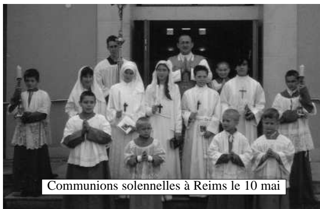
Communions solennelles à Reims le 10 mai