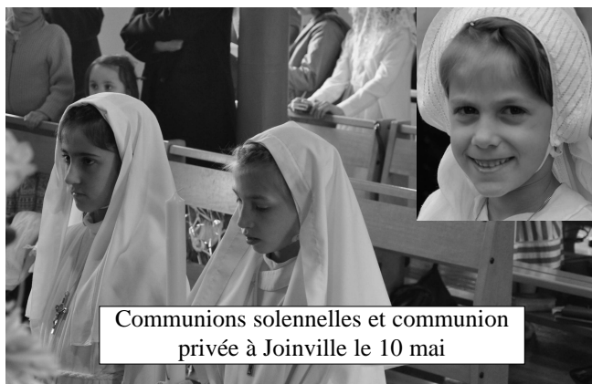
Communions solennelles et communion privée à Joinville le 10 mai