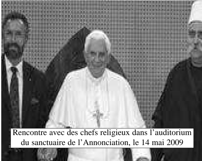
Rencontre avec des chefs religieux dans l'auditorium du sanctuaire de l'Annonciation, le 14 mai 2009