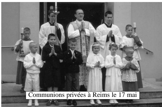
Communions privées à Reims le 17 mai