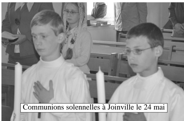
Communions solennelles à Joinville le 24 mai