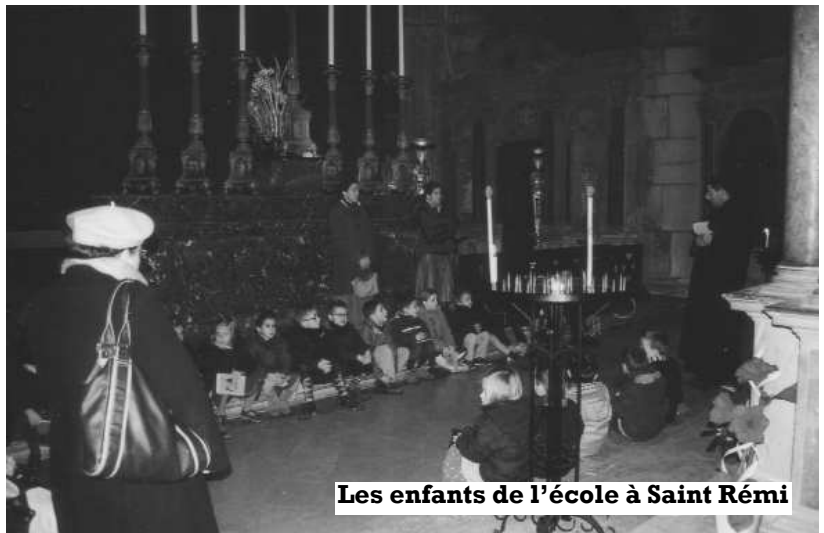
Les enfants de l'école à Saint Rémi

Samedi 22 : Cercle de Tradition à Reims, avec l'étude de l'encyclique de Pie XI Mit Brennender Sorge, sous la direction de l'Abbé Castel.