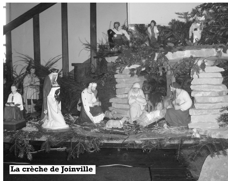
La crèche de Joinville

Vendredi 7 : pèlerinage des élèves de l'école à la basilique Saint-Rémi pour y honorer notre saint patron quelques jours avant sa fête dans le diocèse. Après un