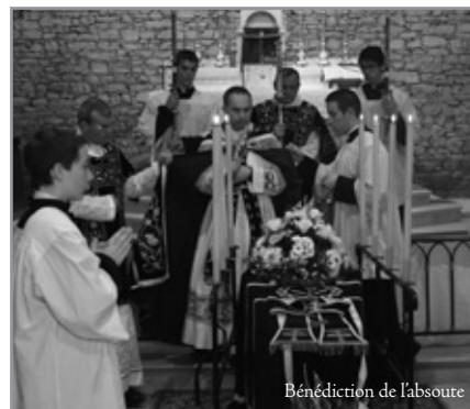
Bénédiction de l'absoute