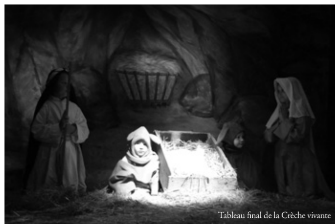
Tableau final de la Crèche vivante