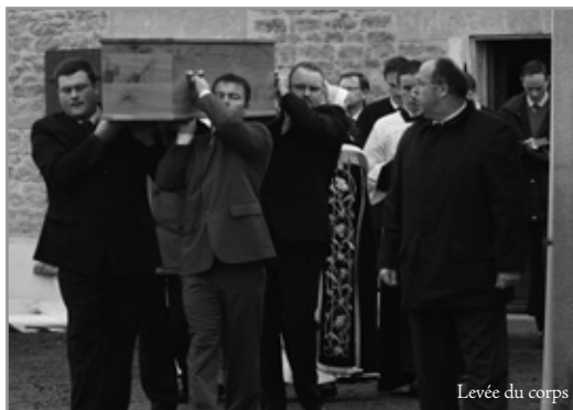
Levée du corps