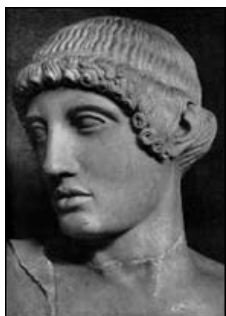
Le sophiste Gorgias

« Les catholiques sont les champions du 'Pourquoi ?' »