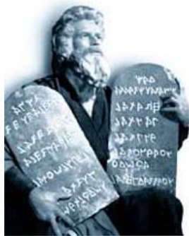
Moïse portant les tables de la Loi.

« L'amour de la finalité est inscrit dans la nature humaine »