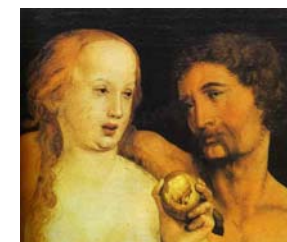
Adam, Ève et le péché

« Satan est le premier sophiste à avoir abusé du langage humain »