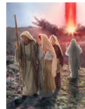
Destruction de Sodome et Gomorre

« Satan est le premier sophiste à avoir abusé du langage humain »