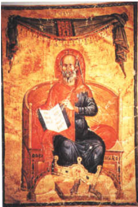
Hippocrate, le Serment...

« L'homme peut se servir de son corps, mais ne peut en disposer comme s'il l'avait lui-même créé ou acquis. »