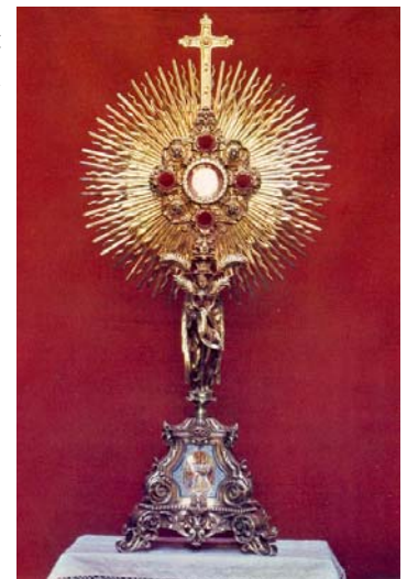
« Monsieur le Maire garda pendant sept ans la grande hostie »