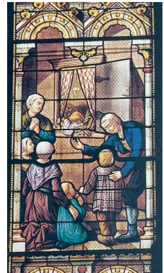
« La maison des Llaurens devint le rendez-vous des âmes pieuses »