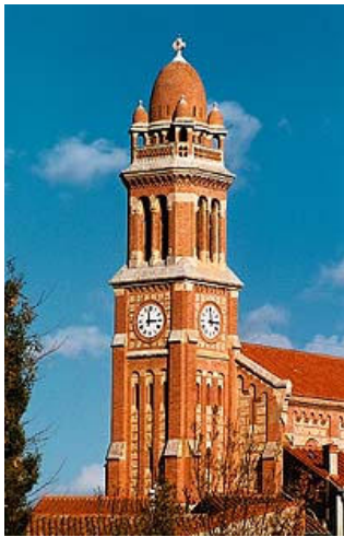
« le fait eut lieu à Pézilla-de-la-Rivière, non loin de Perpignan »