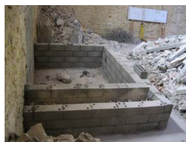
Le soubassement définitif de l'autel