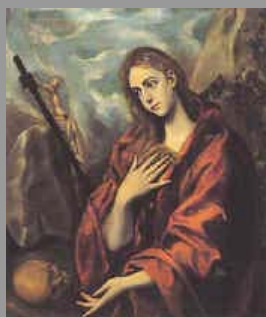
Ste Marie-Madeleine pénitente, El Greco

FRATERNITÉ SAINT-PIE X BULLETIN DES PRIEURÉS DE MONTPELLIER ET DE PERPIGNAN