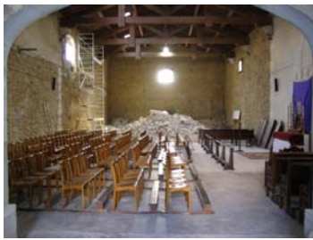
Aménagement provisoire, pendant les travaux