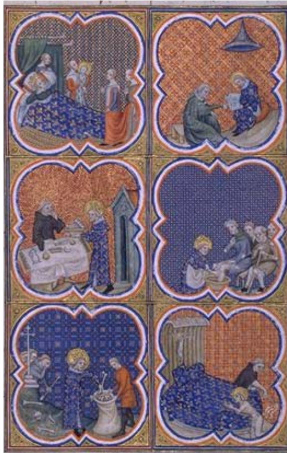
Saint Louis pénitent

Un damné souffre la peine éternelle qui satisfait à la justice de Dieu, mais elle est stérile et ne répare pas ses fautes. Au contraire si nous correspondons aux desseins rédempteurs, notre pénitence devient à la fois expiatrice et réparatrice. Elle satisfait à Dieu, elle purifie notre être, elle ôte le mal et elle édifie le bien, elle acquitte les dettes et elle crée des mérites. La pénitence est comme un cadeau du ciel qui nous donne la possibilité de manifester notre amour de Dieu, par la réparation de notre vie et de nous assurer la vie éternelle.