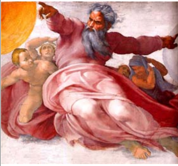
Dieu, Créateur !

« L'homme peut se servir de son corps, mais ne peut en disposer comme s'il l'avait lui-même créé ou acquis. »