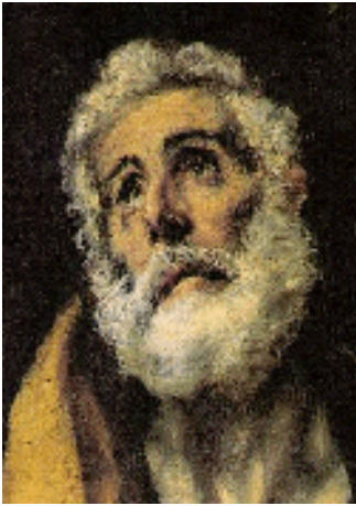
S. Pierre pénitent, El Greco

paix, illusoire, parce qu'au fond on y est pas heureux. L'Évangile agace, parce que l'on sait que c'est la Vérité, et qu'elle seule rend heureux. Mais on n'a plus la force de renoncer à la vie médiocre des mondains.