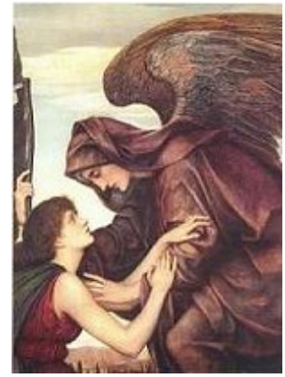
L'ange de la mort

8 Le 18 février 2005, la commission juridique de l'Assemblée générale de l'O.N.U., à une très large majorité, a rejeté et condamné toute forme de clonage humain et toute recherche sur les embryons humains.