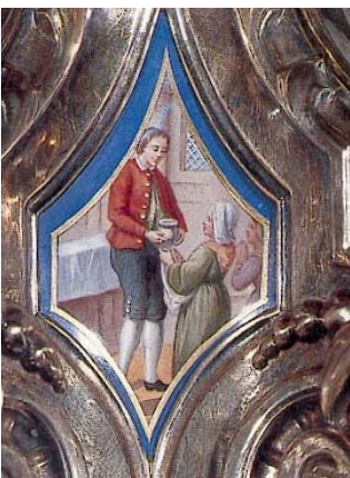
« Rose Llaurens reçoit les petites hosties enveloppées dans un purificateur »