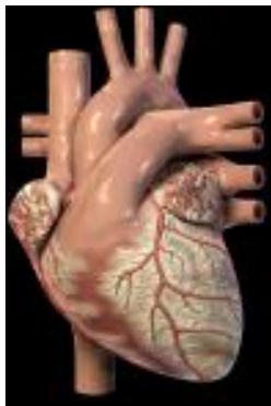
Le cœur, organe vital