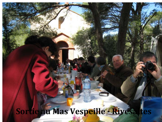
Sortie au Mas Vespeille - Rivesaltes