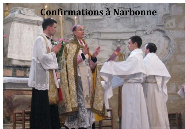
Confirmations à Narbonne