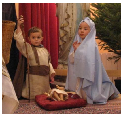
Spectacle de l'Épiphanie de l'école de Fabrègues