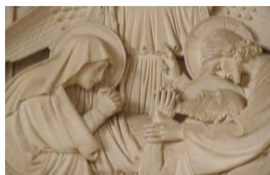
Mort de saint Joseph Eglise de Jallais