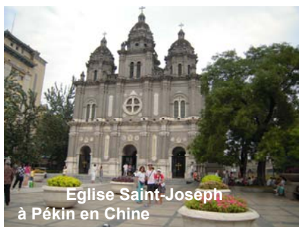
Eglise Saint-Joseph à Pékin en Chine

(Suite de la page 3) soupe, avec des lentilles, un œuf et un flan comme dessert. J'ai cru que j'avais perdu ma cuillère, mais finalement elle était au fond de mon sac. Après on a eu la veillée organisée par la croisade eucharistique de Belgique, avec des chants. Le lendemain on s'est réveillé à 6h00. Départ à 7h00 après un petit déjeuner.