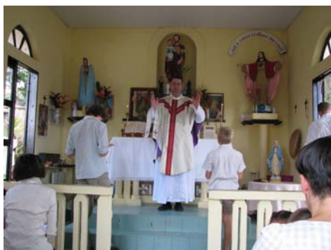
Messe en Guyane