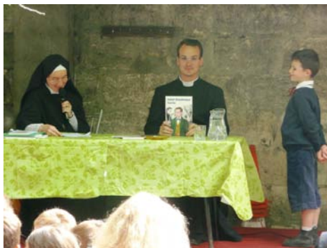
Remise des prix