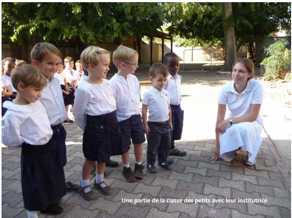
Une partie de la classe des petits avec leur institutrice