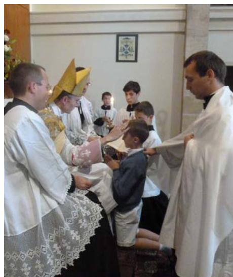
Le prélat confirme