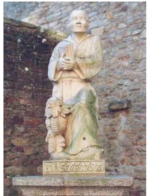
Statue de saint Emilion érigée à Vanne en 1990