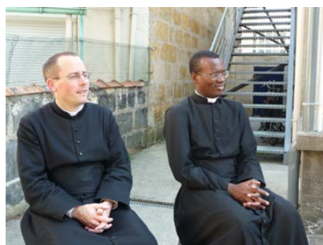
L'ancien (à droite) et le nouveau directeur