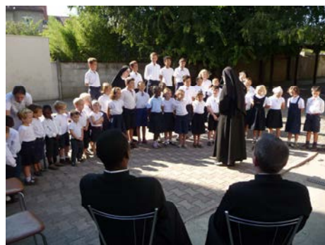
Petit spectacle pour le départ du Père Prudent