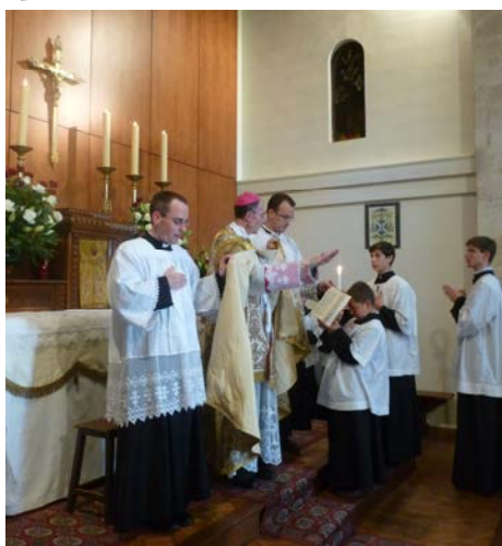
Le prélat impose les mains aux confirmands