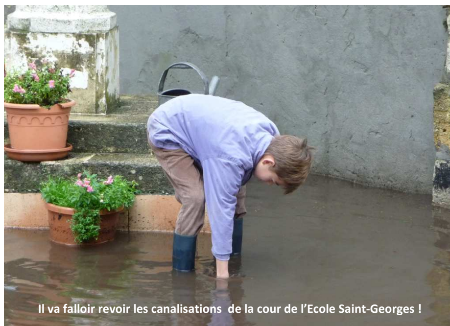
Il va falloir revoir les canalisations de la cour de l'Ecole Saint-Georges !