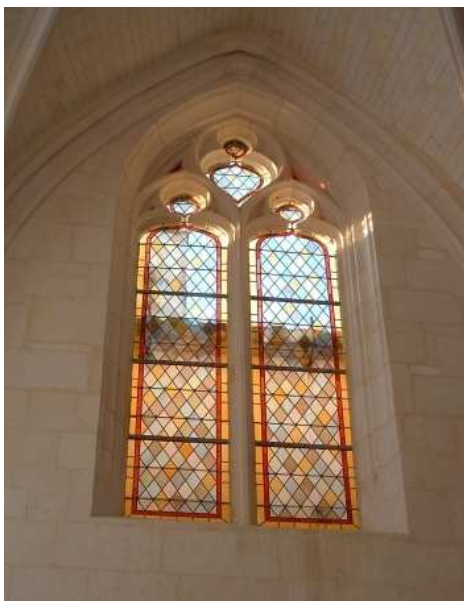
Le premier vitrail posé dans l'église Sainte-Colombe de Saintes