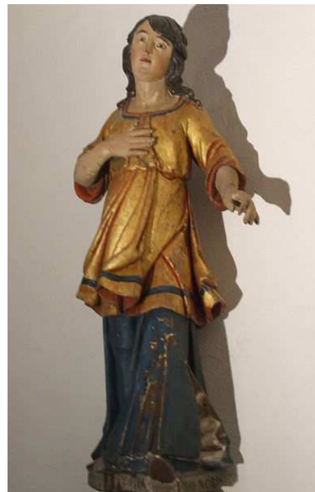
Statue de sainte Quitterie

A Air-sur-Adour, la source « officielle » de sainte Quitterie coule dans la crypte de l'église du Mas d'Aire, sur la colline dominant la ville. La seconde source, moins connue en dehors de la tradition locale, qui la désigne comme l'emplacement du martyre de la sainte, se situe à mi-côte, dans la rue Sainte-Quitterie. La sainte aurait donc été décapitée à cette endroit, où jaillit la première source, puis