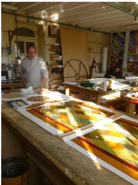
Le vitrail assemblé par le Maître verrier de l'Atelier Saint-Joseph à Ruffec