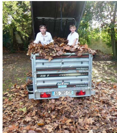
Que de feuilles d'arbres à enlever chaque année. Mais au moins, celles-là, point n'est besoin de les remplir d'écriture. Merci les enfants !