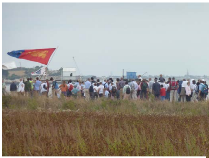
Pèlerinage à l'Île Madame 2012

Cependant, bien que la dîme et le denier du culte relèvent fondamentalement d'un devoir en justice envers l'Église, tandis que l'aumône est un acte de charité pour le prochain, il arrivera souvent que dîme et denier du culte seront également des œuvres de charité tant dans l'intention de celui qui donne, que dans l'objet puisque c'est un moyen indirect de