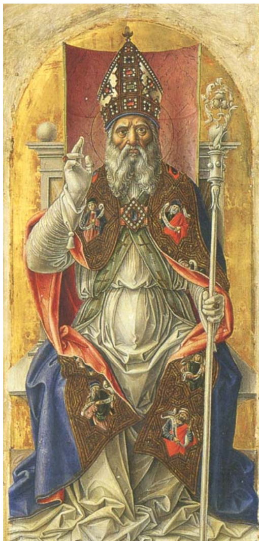
Saint Ambroise (Bartolomeo Vivarini)