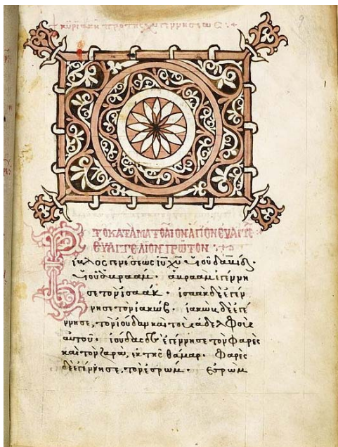
manuscrit de l'Evangile de Saint Mathieu

Telle fut la règle dans l'Eglise primitive aussi bien en Orient qu'en Occident. Avant même la fin des persécutions, des Conciles provinciaux statuaient sur la question et rappelaient la discipline héritée des Apôtres : les Ministres de l'Autel se consacrent à Notre Seigneur Jésus-Christ et se vouent à la chasteté parfaite.