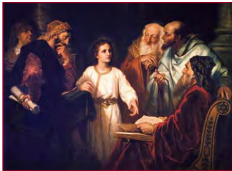
L'Enfant Jésus fait le catéchisme à 12 ans

Mais la grâce de Dieu est là. Par elle, nous pouvons vaincre à la fois la faiblesse de notre volonté et l'ignorance de notre intelligence. Si nous prions Dieu de nous encourager, Il se fait une joie de nous aider à nous instruire de ses vérités. N'oublions pas que Notre Seigneur est mort pour avoir prêché ces vérités et en particulier pour avoir affirmé sa divinité.