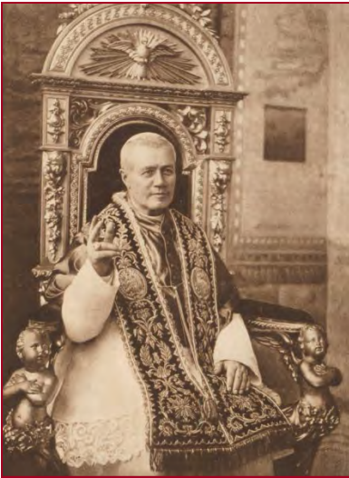
Saint Pie X encouragea les études chez les prêtres et les fidèles

Saint Pie X a toujours eu ce souci d'enseigner la parole de Dieu autour de lui. Simple prêtre, évêque, archevêque puis pape, jamais il ne s'est écarté de cette noble mission de pasteur dans l'Église. C'est qu'il connaissait les conséquences désastreuses de l'ignorance pour les âmes. D'ailleurs les ennemis de Dieu et de l'Église le savent, eux qui utilisent tout leur pouvoir pour augmenter cette ignorance.