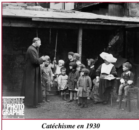
Catéchisme en 1930

L'ignorance volontaire ou vincible de ce que nous devons et pouvons savoir est un péché plus ou moins grave, selon la gravité des obligations auxquelles on man-