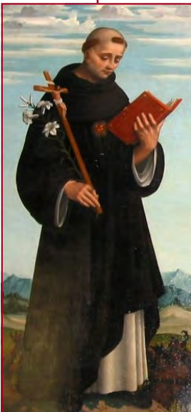
SAINT NICOLAS DE TOLENTINO 1245-1306 Fête le 10 septembre

Joignant alors les mains, il jeta un dernier regard sur la croix et s'écria : « Mon Père, je remets mon esprit entre vos mains », et il rendit l'âme. C'était le 10 septembre 1306.