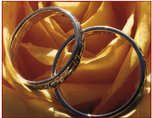
Les anneaux, signes du lien conjugal

Quand il concerne des chrétiens, il est un empiètement de l'Etat sur l'Eglise. Puisque Notre-Seigneur en a fait un sacrement, il échappe au pouvoir civil. En imposant la forme civile du mariage, l'Etat outrepassse ses droits, surtout en permettant le « remariage ». Pour accorder les effets civils du mariage reçu devant le prêtre, l'Eglise recommande de se « marier » à la mairie auparavant mais ce « mariage » n'a aucune valeur à ses yeux. Il a d'autant moins de valeur aujourd'hui que le mariage civil ne correspond plus à