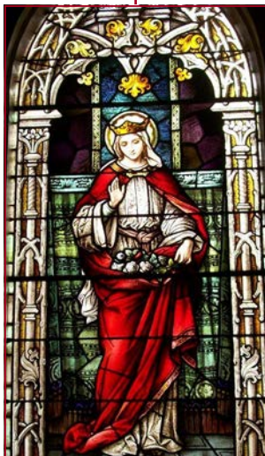
SAINTE ELISABETH Reine du Portugal Fête le 8 Juillet

Elle récita le Credo , une prière à la Vierge, baisa son crucifix et s'endormit dans le Seigneur, en l'an 1336, à l'âge de soixante-cinq ans.