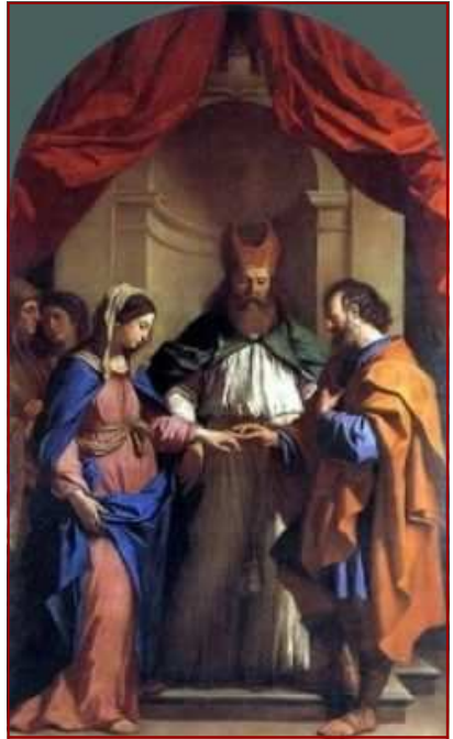
Mariage de la Très Sainte Vierge et de Saint Joseph