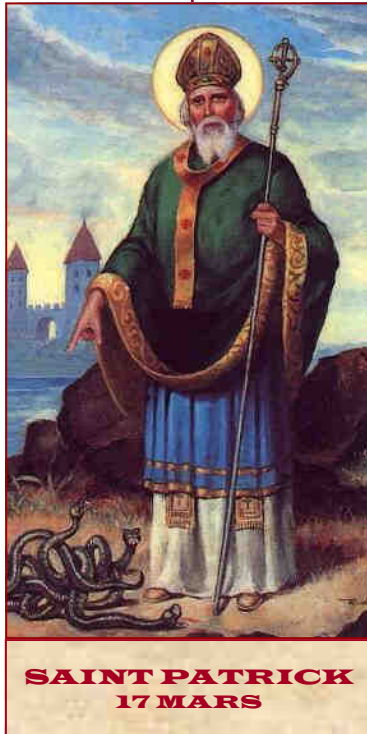
SAINT PATRICK 17 MARS

Averti que l'heure de sa fin est proche il se dirige alors vers le monastère de Saul et aussitôt se couche et rend son âme à Dieu le 17 mars 463. ♦