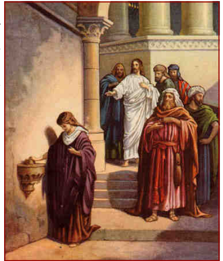
La veuve louée par Notre Seigneur pour sa modestie (Marc chap.12)

LA MODESTIE. Cette vertu, c'est-à-dire cette bonne qualité de l'âme règle tout notre comportement extérieur : l'appréciation que nous nous faisons de nous-mêmes, la curiosité, nos moindres mouvements ainsi que la parure de notre corps.