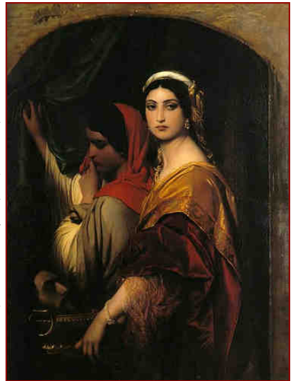
La tête de Saint Jean-Baptiste obtenue pour le prix d'une danse

Celui qui prend soin de la vertu de modestie à l'avantage d'agir en amont, n'évitant pas seulement le péché mais éloignant ses occasions. Cette pratique n'est d'ailleurs pas seulement de conseil, elle est nécessaire pour sauver notre âme car Notre Seigneur nous dit avec la prière de VEILLER.