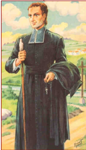
SAINT LOUIS- MARIE GRIGNON DE MONTFORT 28 Avril