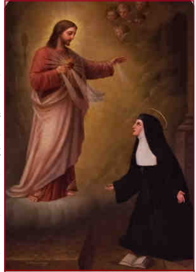
Apparitions du Sacré-Cœur à sainte Marguerite Marie 1675

En revanche, dans les autres apparitions de Notre Seigneur Jésus-Christ depuis son Ascension, comme celle du Sacré-Cœur à sainte Marguerite-Marie, il n'est pas sûr qu'il apparaisse avec son vrai corps.