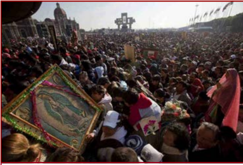
Pèlerins autour de Notre Dame de Guadalupe

La foi de l'Église catholique aux divines Écritures ne lui permet pas de douter des nombreuses apparitions mentionnées par ces livres sacrés, depuis celles de Dieu au premier