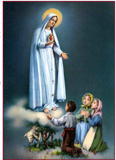
Notre Dame de Fatima 1917

OUI : celles qui sont mentionnées dans la Bible parce que la Sainte Ecriture, ayant Dieu pour auteur, ne contient aucune erreur. Il en est ainsi pour les apparitions tant dans l'Ancien que dans le Nouveau Testament, que ce soit de Dieu, des Anges ou des défunts.