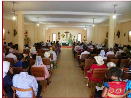
En attendant les bancs et les lustres

Tous les cœurs étaient unis dans l'action de grâces pour tout le chemin parcouru depuis les messes à l'Habitation Néron, puis à Pointe à Pitre, sous le regard vigilant et maternel de Notre Dame de Guadeloupe, qui ne manquera pas d'attirer de nombreuses âmes de bonne volonté au pied de l'autel.