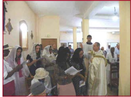
... puis de l'intérieur