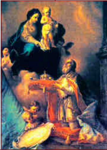
SAINT ETIENNE Roi de Hongrie Fête le 2 Septembre