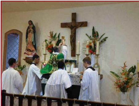
Notre Dame de Guadeloupe à l'honneur à côté de l'autel