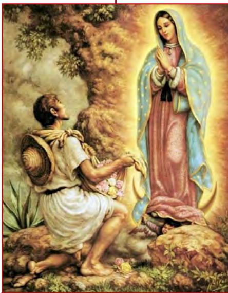
ND de Guadeloupe Fête le 12 décembre

Quand l'évêque vit l'image, lui et tous ceux présents crurent et tombèrent à genoux pour vénérer la Sainte Vierge que l'on allait prier à sa demande sous le beau vocable de Notre Dame de Guadalupe. ♦