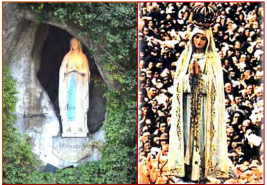
Lourdes et Fatima : des valeurs sûres !

L'approbation d'une révélation privée par l'Eglise ne nous impose jamais de croire comme de foi en celle-ci, mais nous demande seulement de croire d'un pieux assentiment et de foi humaine selon les règles de la prudence de la même manière que nous croyons à des faits historiques. La déclaration du Saint-Siège est là pour nous faire éviter la superstition et l'irrégiosité. Pour celui qui s'intéresse aux apparitions par curiosité ou par piété, c'est l'excès de piété dans ce qui ne le mérite pas qu'il doit éviter. Fions-nous pour cela à la prudence surnaturelle, elle nous aidera à croire en ce qui est limpide et sans ambiguïté, et à chercher la vérité dans ce qui est sans ombre d'erreur comme les apparitions de Lourdes et de Fatima. ◆