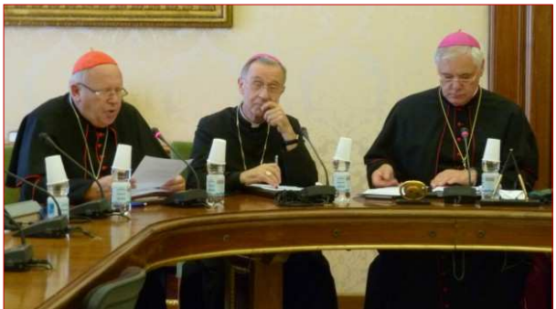
Jugement de la Congrégation pour la Doctrine de la Foi.

Nous avons considéré l'apparition de Medjugorje à la lumière des principes de discernement des esprits, puis nous l'avons comparée aux apparitions déjà reconnues par l'Eglise afin de déterminer son origine, et d'avoir le juste comportement à son égard. Mais est-ce la ferveur populaire ou l'analyse de chaque fidèle qui est le critère déterminant de l'authenticité, ou y a-t-il un jugement officiel ? Les « Normes de discernement des apparitions et des révélations » approuvées par le pape Paul VI reconnaissent l'évêque du lieu, chargé de se prononcer et d'intervenir à ce sujet, puis dans certains cas la décision peut dépendre de la Congrégation pour la Doctrine de la Foi. Voici donc la voix officielle de l'Eglise.