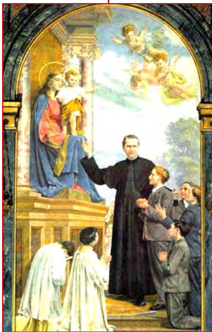
Saint Jean Bosco Fête le 31 janvier

Fatigué, usé par tant de travaux, il rejoignit le repos éternel le 31 janvier 1888 et fut canonisé en 1934. ♦