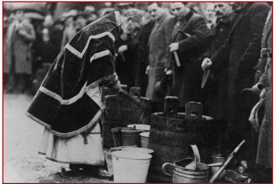
Cérémonie de bénédiction de l'eau bénite

Seul le prêtre peut faire de l'eau bénite. Il commence par exorciser et bénir séparément le sel et l'eau. Puis il répand par trois fois en forme de croix le sel exorcisé sur l'eau en prononçant les paroles : « Que ce mélange de sel et d'eau se réalise au nom du Père et du Fils et du Saint-Esprit. Ainsi soit-il. » Il achève la bénédiction par une ultime prière au Bon Dieu.