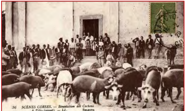
36 SCÈNES CORSES. — Bénédiction des Cochons à Zilia (avant). — LL. S. MARCO.

Or, pour chasser le démon des lieux, des choses et des personnes qu'il tyrannise, quelles sont les armes les plus anciennes, les plus universelles, les plus habituelles,