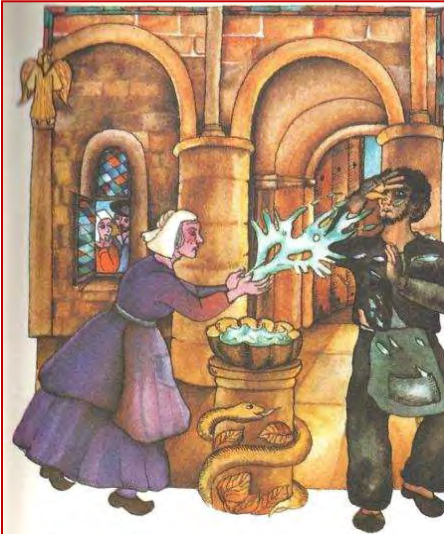
L'eau bénite : moyen efficace pour chasser l'esprit du mal !

L'eau bénite est un sacramental. Qu'entend-on par les sacramentaux ? On entend des actes extérieurs de religion, consacrés par l'Église et qui ont la vertu de produire des effets surnaturels.