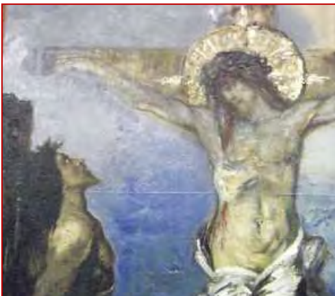
L'ascèse est nécessaire dans la vie spirituelle

OUI et c'est précisément parce qu'il réagit contre certains excès que le charismatisme attire les catholiques troublés par la crise, mais pour les ramener aux erreurs qui causent cette terrible crise. De même que le pentecôtisme a ramené au protestantisme ceux que son excessive rigidité faisait fuir en masse.