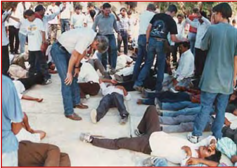
Où serait le Saint-Esprit ?

La prédication de Notre-Seigneur Jésus-Christ qui est le fruit de l'Esprit-Saint dans l'apostolat que nous avons à mener, amène des persécutions. Il ne faut pas se faire d'illusions. Nous sommes pour Notre-Seigneur, le monde est contre Notre-Seigneur. Les pécheurs sont contre Notre-Seigneur. Il l'a dit lui-même : Le monde me hait et il vous haïra si vous m'aimez et si vous me servez. Regardons l'exemple de Saint Etienne, sa foi, l'ardeur de sa prédication, le rayonnement de sa prédication et de sa foi... et la persécution évidemment !