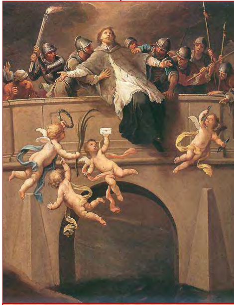
Saint Jean Népomucène Fête le 16 mai

Mais le corps du martyr à peine fut-il étouffé sous les eaux qu'une clarté merveilleuse plana à la surface du fleuve, immobile d'abord, puis suivant lentement le courant, à la grande admiration de la ville entière. ♦