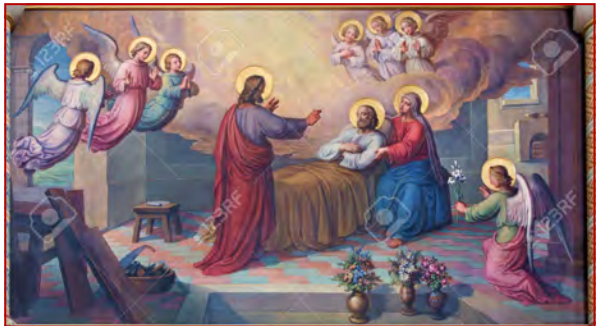
La sainte mort de Joseph le juste

D'allure très scientifique et très digne, le terme d'euthanasie recouvre parfois, en fait, des choses beaucoup moins nettes et beaucoup plus brutales. Si l'on prend son sens étymologique, il signifie « bien mourir » ou, si l'on peut s'exprimer ainsi, « mourir agréablement ». Selon cette définition, une personne qui se préoccupe d'euthanasie se préoccupe d'adoucir au maximum la mort de ses concitoyens. A première vue, il n'y a rien de plus louable. Tout le monde est d'accord sur cette élémentaire charité humaine qui consiste à adoucir les souffrances de quelqu'un et à lui rendre la mort la moins odieuse possible. Ce n'est pas cela qui fait discussion. Mais sous prétexte d'abrégier les souffrances d'un malade, peut-