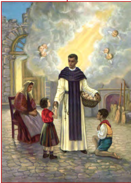
Saint Martin de Porrès Fête le 3 novembre

et implorent l'aide de Dieu par l'intercession de Martin. Les dominicains construisent une chapelle pour abriter sa tombe hors de la clôture du couvent. Ce transfert s'opère 25 ans après sa mort. La tombe ouverte, des témoins affirmèrent que son corps était intact. Le pape Jean XXIII canonise Saint Martin de Porrès le 6 mai 1962. ♦