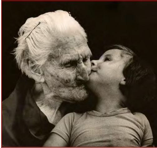
Honore ton père et ta mère

L'euthanasie, c'est-à-dire la volonté de provoquer la mort, est évidemment condamnée par la morale. Mais si le mourant y consent, il est permis d'utiliser avec modération des narcotiques qui adoucissent ses souffrances, mais aussi entraîneront une mort plus rapide. Dans ce cas, en effet, la mort n'est pas voulue directement, mais elle est inévitable de toute manière, et des motifs proportionnés autorisent des mesures qui hâteront peut-être sa venue.