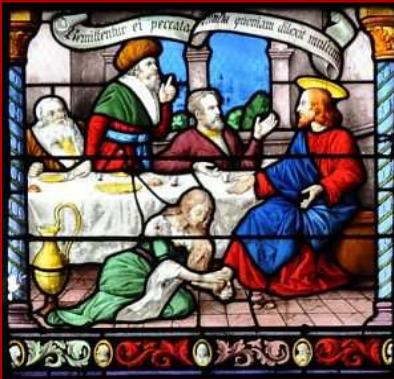
Marie-Madeleine obtient miséricorde

Refuser Dieu à cause du mal ne peut être la réponse, puisque précisément ce refus laisse le mal sans solution. On ne peut répondre au mystère du mal que par le mystère de Dieu. Tant que nous regardons le mal en dehors de la foi, tant que nous refusons de voir le mal à la lumière de Dieu, nous nous fermons nous-mêmes à toute espérance. Nous ne pouvons pénétrer un mystère qu'en nous enfonçant dans l'autre. Selon notre connaissance du mal