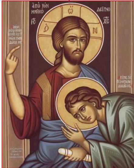
Saint Jean l'Évangéliste Fête le 27 décembre

L'apôtre parvint à une extrême vieillesse et mourut 68 ans après la passion de son divin Maître. ♦