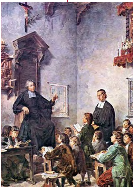
Saint Jean-Baptiste de La Salle Fête le 15 mai