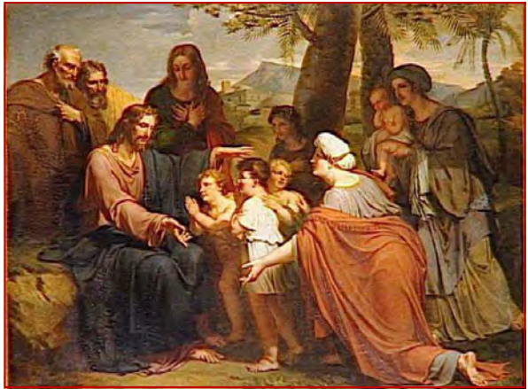
L'éducation : Conduire les âmes à Jésus

« Former quelqu'un », c'est cultiver une de ses aptitudes, en utilisant les méthodes les mieux appropriées et les plus efficaces. Nous appelons « maîtres » et « maîtresses » ceux qui nous initient à ce savoir-faire. Tout métier, toute profession, même celle de boulanger ou de cordonnier, exige un apprentissage. Nul homme, même excep-