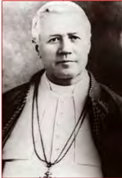
Saint Pie X Fêté le 3 septembre

sous son heureux pontificat que les petits enfants furent appelés à communier dès l'âge de raison. ♦