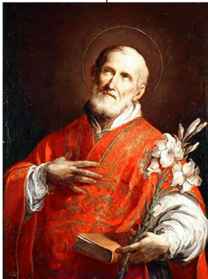
St Philippe Néri fêté le 26 mai

Il s'éteint le 26 mai 1595. Une foule immense se presse pour lui rendre hommage. Son procès de béatification traîna en longueur mais les Romains n'avaient pas attendu le jugement. Les historiens s'accordent pour dire que ce fut la dernière canonisation par acclamation dans l'histoire de l'Église. ♦