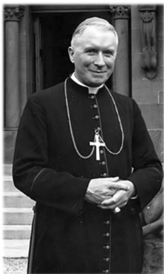
Mgr Marcel Lefebvre

Léon XIII (pape de 1878 à 1903) disait : « j'ai la conviction que c'est par le Tiers-Ordre que nous sauverons le monde » . Son successeur Saint Pie X (1903-1914) précisait : « cette restauration de toutes choses dans le Christ qui me tient tant à cœur, c'est du Tiers-Ordre que j'en attends l'accomplissement » . Pie XI conclut que « par l'institution du Tiers-Ordre sont jetés les fondements d'une société nouvelle (...) qui font de la société civile une alliance fraternelle, cimentée par la pratique de la vie chrétienne » .