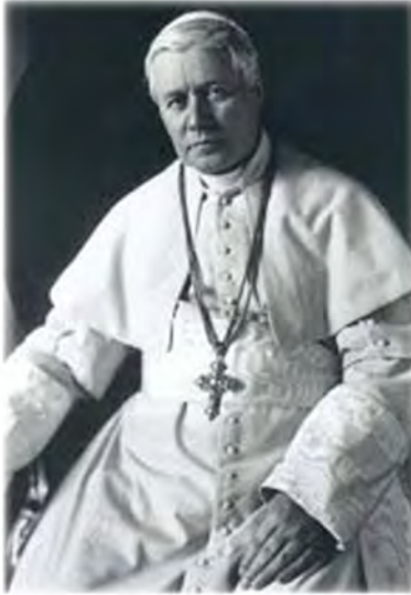
Pie X, pape

Or le pape Saint Pie X a été canonisé pour avoir courageusement dénoncé ces erreurs modernes et montré l'exemple de la sainteté dans la fermeté de la doctrine, la pureté des mœurs et la dévotion au Sacrifice eucharistique. Ce saint pape est donc tout indiqué pour être le modèle des âmes désireuses de se sanctifier à notre époque.