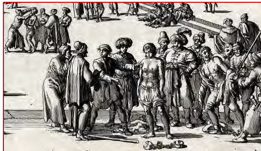
Illustration : Marché aux esclaves d'Alger, 1684 - gravure

Louis Abelly. Vie de saint Vincent de Paul , t. 2 Mission en Barbarie