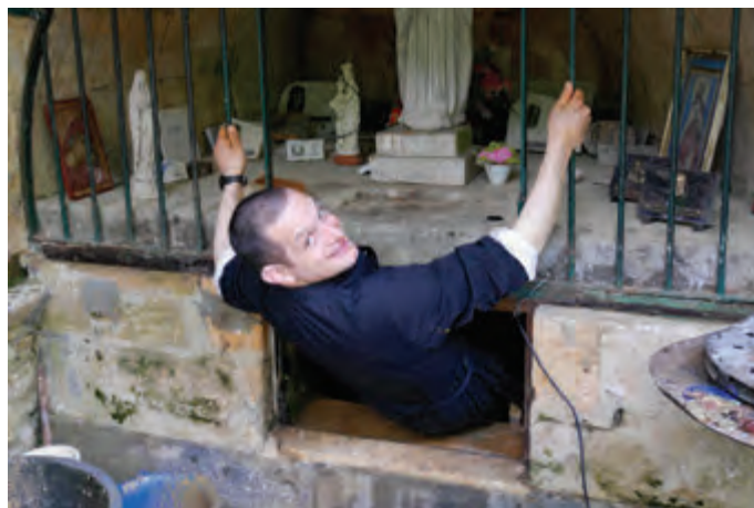
1er mai 2018-nettoyage de la citerne

Je sais que c'est Notre-Dame de Fontpeyrine et personne d'autre – qui m'a rétablie, à sa guise, en son temps et comme bon lui semblait.»