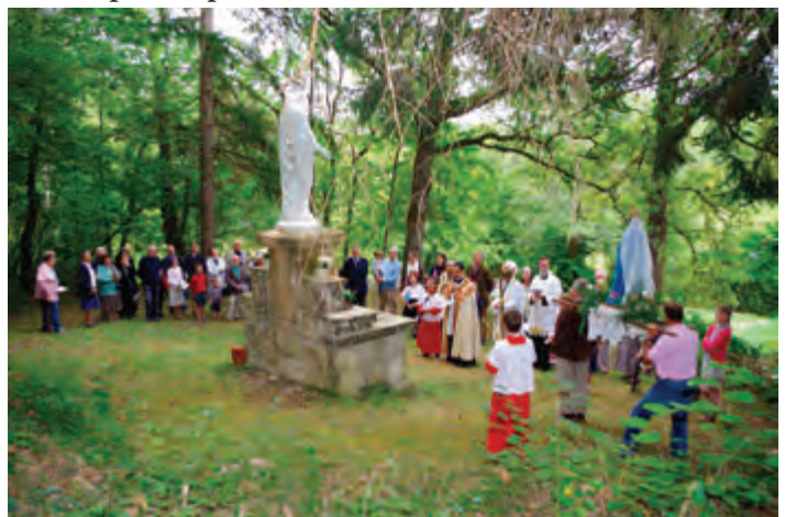
Procession du chapelet-8 septembre 2017

Tout à coup le travail semble bien s'accélérer, je me dis alors que ça va vite se faire, tant mieux... mais plus ça passe moins j'ai le temps de souffler, mon mari contrôle vers 14h je suis à une contraction de 45s toutes les minutes... c'est trop... de la chambre nous allons au service des naissances, et oui c'est trop rapide: maman ne souffle pas et surtout le cœur de bébé faiblit car lui non plus ne peut pas reprendre son énergie... le verdict tombe: césarienne en « urgence orange » ... tout s'active autour de nous et je prie comme je peux: Mon Dieu sauvez nous!! Sauvez notre bébé!! Notre Dame de Fontpeyrine!!! Mais ce n'est pas fini le temps que l'on m'installe et que l'on fasse l'anesthésie je perds les eaux... avec aussi des caillots de sang... je faisais un décollement du placenta, HRP: l'urgence passe au « rouge », il est 15h, bébé est en réel danger et probablement déjà mal en point... La sage-femme écoutera jusqu'au dernier moment le cœur de bébé pour me rassurer, et dans ma tête les « Je Vous Salue » s'enchaînent... Le temps est suspendu pour moi (...)