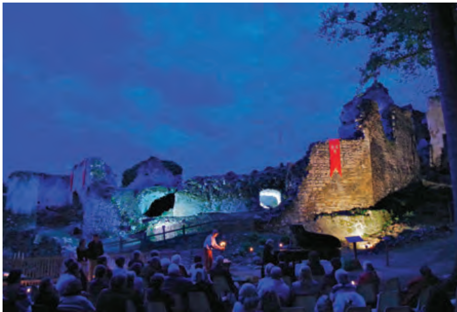
8 septembre 2017—concert spirituel à la Madeleine pour clore le jubilé