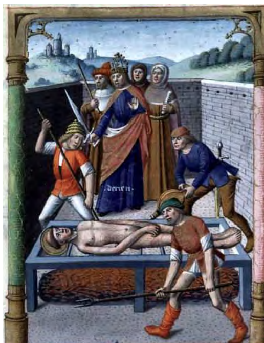
Martyre de saint Laurent

Evidemment, nul catholique digne de ce nom ne peut se réjouir du péché. Les larmes de contrition sont louables