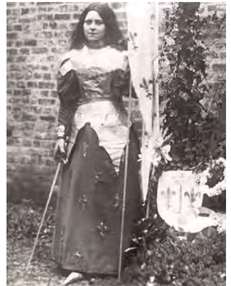
sainte Thérèse de l'Enfant-Jésus interprétant sainte Jeanne d'Arc au Carmel

regarde heureux au ciel, heureux au tabernacle, bon ou mauvais, quel que je sois, Vous êtes heureux, ô mon amour, rien ne peut Vous arracher votre bonheur, rien par conséquent ne peut m'ôter le mien » 2 .