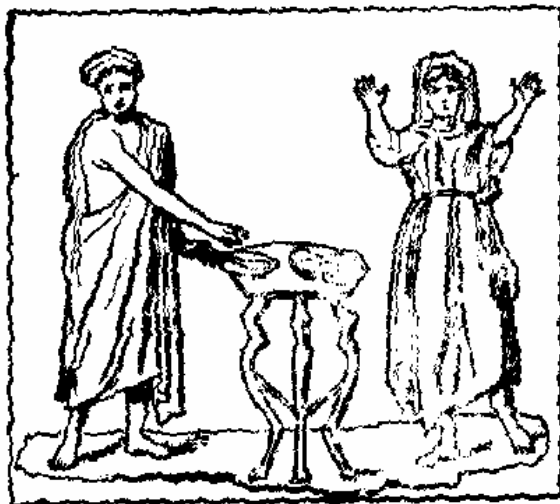
La Messe dans les catacombes. La Messe traditionnelle est, quant à sa substance, la même que celle qu'ont célébrée les saints Papes et Martyrs des premiers siècles !

pratiquement plus à la messe traditionnelle de notre sainte Eglise catholique, comme nous l'avons déjà dit dans les colonnes du St Pie. Oui ! Répétons-nous pour les nouveaux lecteurs : le Novus Ordo , la Nouvelle Messe « s'éloigne de façon impressionnante, dans l'ensemble comme dans le détail, de la théologie catholique de la sainte messe, telle qu'elle a été formulée à la XX e session du Concile de Trente » affirmaient les Cardinaux Ottaviani et Bacci dans leur Bref Examen Critique de la Nouvelle Messe présenté au Pape Paul