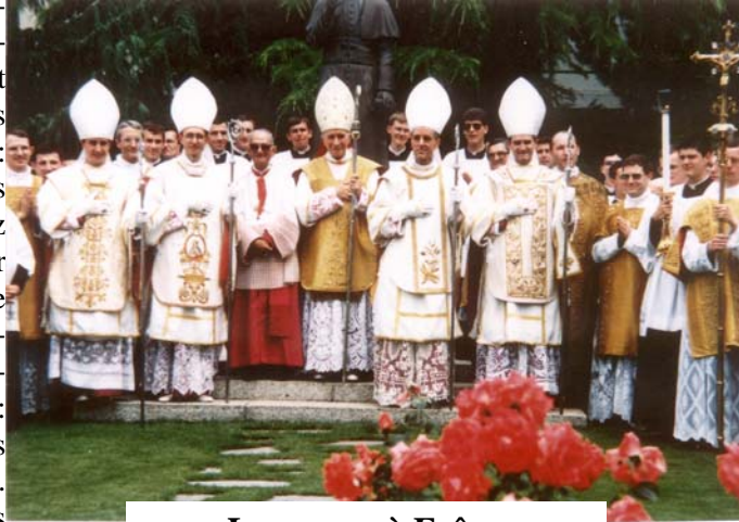
Les sacres à Ecône

Le jour des sacres, Monseigneur commença à nous parler de la tentative d'enlèvement dont il faillit être la victime, la veille au soir. Cela