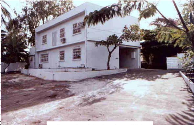
La maison à La Peyrie en 1986