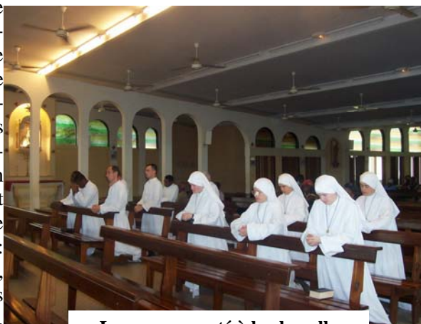
La communauté à la chapelle