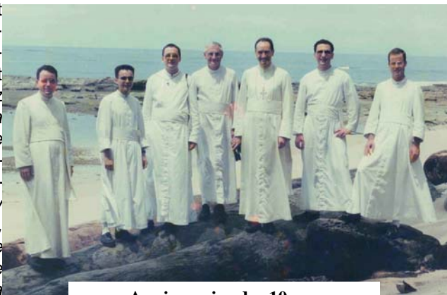
Anniversaire des 10 ans de la Mission

C'est donc remplis d'action de grâces que nous considérons la multitude des grâces que le Bon Dieu a daigné répandre sur les âmes par nos mains. Mais notre plus grande joie reste d'avoir été des serviteurs inutiles. Puisse-nous rester tels pour que notre joie demeure et surtout pour que, par notre ministère, le Nom de Dieu atteigne la perfection de sa Gloire dans les âmes « car, dit saint Paul, la puissance (de Dieu) atteint sa perfection dans la faiblesse (de l'homme) ; c'est pourquoi je préfère bien volontiers me glorifier de mes faiblesses, afin que