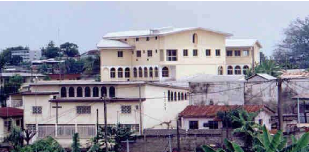
L'église et la mission aujourd'hui

vraie marque d'une sincère conversion et la plus grande preuve de reconnaissance devant tant de bonté. C'est bien tout ce que le bon Dieu nous demande.