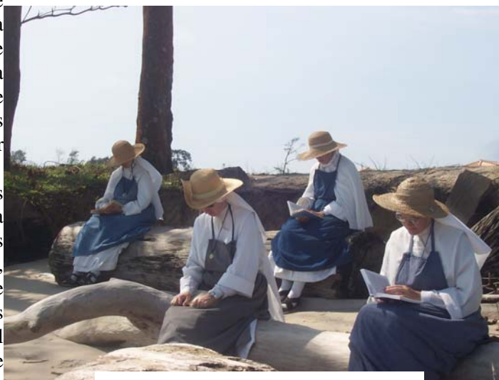
Temps de prière au cours d'une sortie de communauté de nos sœurs