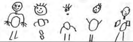
Dessins d'enfants laissés à eux-mêmes regardant la TV plusieurs heures par jour

Enfin, un troisième crime de la télévision est de rendre les gens agressifs . « Un téléspectateur moyen voit environ 2600 crimes par an et 13000 actes violents par an » peut-on lire dans la recension citée. Il en va ainsi : à force de voir des crimes, des meurtres, des coups et des blessures, l'homme s'habitue à la violence et devient lui-même violent.