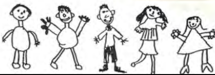
Dessins d'enfants regardant au maximum la TV 60 min par jour

Elle est partout : dans toutes les maisons ; dans toutes les villes ; dans les villages de brousse les plus reculés ; dans toutes les chambres ; dans tous les restaurants ; dans tous les bistros. Elle ne se tait jamais, elle parle sans interruption ; elle vous coupe la parole et ne vous écoute pas ; elle prétend avoir toujours raison.