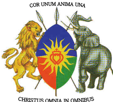
Armes du district d'Afrique de la Fraternité Saint-Pie X

En 2002, l'abbaye de Saint-Maurice reçut des reliques d'autres martyrs africains plus récents, ceux de l'Ouganda. La dévotion populaire aux martyrs d'Ouganda prit une dimension universelle, après que saint Pie X les ait proclamés vénérables. Le 22 juin 1934, Charles Lwanga, le chef des pages martyrisés sous le roi Mwanga, a été déclaré par Pie XI « patron de la jeunesse africaine ».