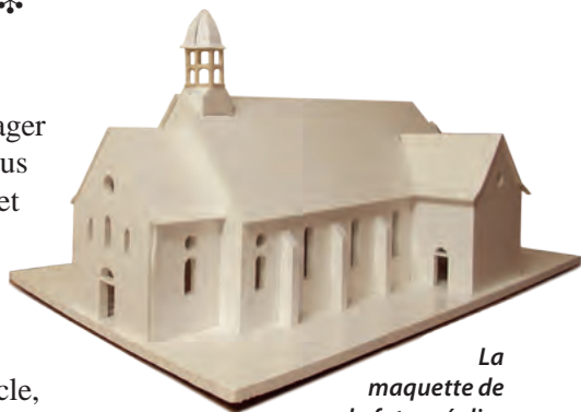
La maquette de la future église

La grande nouvelle que nous voulons partager avec vous, chers bienfaiteurs, parce que vous avez participé à nos espoirs, par vos prières et votre soutien, c'est le commencement des travaux de la future église à St-Michel-en-Brenne, que nous voulons dédier à Saint Cyran. Elle ne sera pas à l'endroit exact où s'élevait l'église abbatiale du XI e siècle, mais dans son prolongement. Ce ne sera pas, malheureusement, un aussi beau sanctuaire ! Mais le projet s'harmonisera très bien aux lieux et aux besoins de notre communauté.