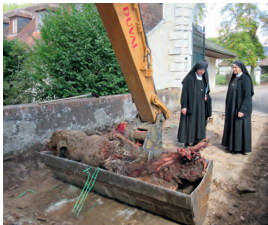
Les arbres voisins avaient poussé leurs racines jusque dans le pont...

Avec l'édifice sacré, s'élèvera également un bâtiment en T le reliant à ceux qui