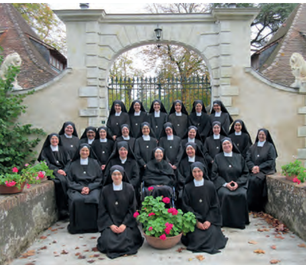
La communauté de l'abbaye Saint-Michel

Notre édifice « sera toujours indigne de la grandeur, de la subtilité, de la perfection, de la toute-puissance de Dieu. Mais cependant, que tous ceux qui y pénètrent aient au moins ce sentiment de grandeur, de noblesse, de la présence de Dieu. Qu'ils aient le désir de s'agenouiller, d'adorer Dieu, de porter sur lui un regard de foi afin de participer vraiment au mystère de Dieu.