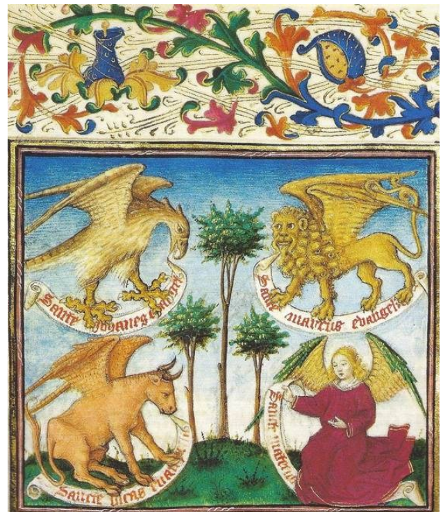
Symboles des quatre évangélistes Maitre de Gysbrecht de Brederode