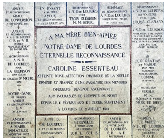
Ex-voto dans la basilique de l'Immaculée Conception