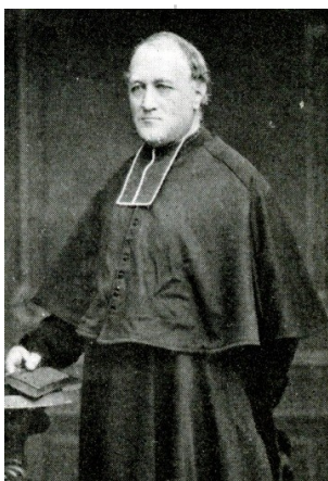
Abbé Victor Chocarne

« Le soir, la Grotte fut illuminée et de nombreux pèlerins y allèrent réciter le rosaire. Puis, à l'instigation du P. Marie-Antoine, capucin, chacun, armé d'un cierge allumé, se mit en marche : ce fut la première procession aux flambeaux [pour une si grande foule de 50.000 pèlerins]. On contourna la Grotte et l'église supérieure, comme pour les ceindre d'une couronne lumineuse, et on suivit les « lacets », sentiers sinueux tracés le long de la colline, à travers les roches, les arbres, les buissons que le Créateur y a semés ou suspendus. Des milliers d'hommes et de femmes, de prêtres et de laïcs, échelonnés sur toutes les pentes des rochers et des coteaux depuis la montagne jusqu'à la ville ; des voix qui se répandaient en chantant les invocations des litanies et les strophes de l'Ave Maris Stella, et qui se mêlaient au bruit des eaux du torrent ; de mobiles spirales de lumières, qui montaient, descendaient, se brisaient et se renouaient pour disparaître derrière des masses d'ombre. Tout cela offrait un spectacle unique et grandiose tout ensemble. C'était le ciel avec ses étoiles, les torrents avec leurs voix, les montagnes avec leurs échos, les hommes avec leurs