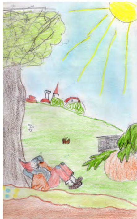
Illustration de la fable par un élève

profondeur les réalités qui l'entourent et de saisir l'harmonie qui règne entre elles. Après bien des labeurs, la pensée grecque a réussi à rendre compte du monde : elle a travaillé à lire à l'intime des choses ce qu'elles sont – là est l'étymologie du mot « intelligence » : « qui lit dans les choses » ( intus legere ). Elle a manifesté que ces réalités naturelles étaient constituées pour un but déterminé : un cheval est « disposé » ainsi pour remplir sa