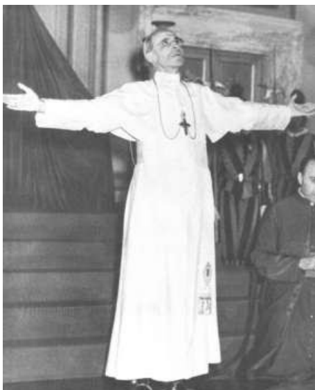
Le Pape Pie XII

Afin de trouver une ligne de conduite propre à nous édifier et à nous stimuler, une nouvelle ru-