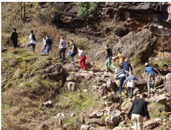
Sortie sur les pas de Roland

Ces grâces sont les plus nécessaires à votre âge. Elles suffisent pour vous tenir sur le chemin qui fera de vous des hommes respectables plus tard, preuve cer-