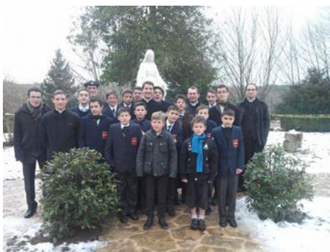
La délégation de l'école à Flavigny

Il reste à préparer la Semaine Sainte et à clore le plus saintement possible ce deuxième trimestre. En vous donnant rendez-vous pour la kermesse du samedi 16 mai, les prêtres, frères, sœurs, professeurs et élèves vous souhaitent à tous de saintes fêtes de Pâques.