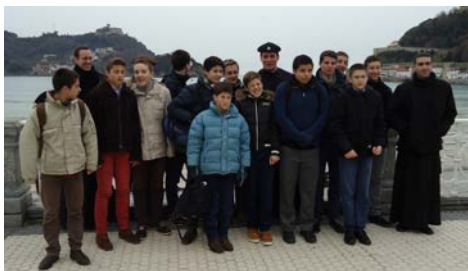
Sortie à Saint-Sébastien

Nous célébrons cette année le II e centenaire de Saint Jean Bosco, prêtre, fondateur des Salésiens et modèle d'éducateur de la jeunesse. Il est né en Italie en 1815. Pour l'occasion, nous vous offrons un texte qui manifeste la grande dévotion de Don Bosco pour la Reine du Ciel, qu'il aimait invoquer sous le titre de Marie Auxiliatrice.